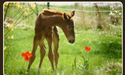
For mere sikker pleje af din hest, samt tryghed når hesten skal fole.