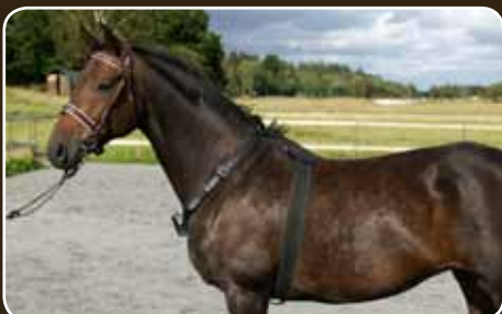
horseAlarm sidder sikkert fast på din hest.