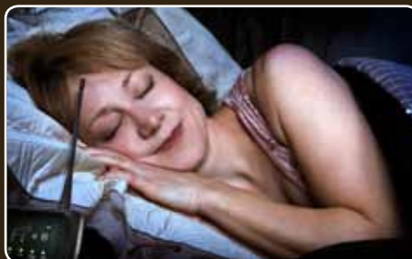
Tryk overvågning hjemmefra.